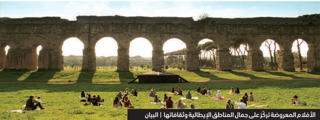
الأفلام المعروضة ترفع على جمال المناطق الإيطالية وثقافتها | البيان