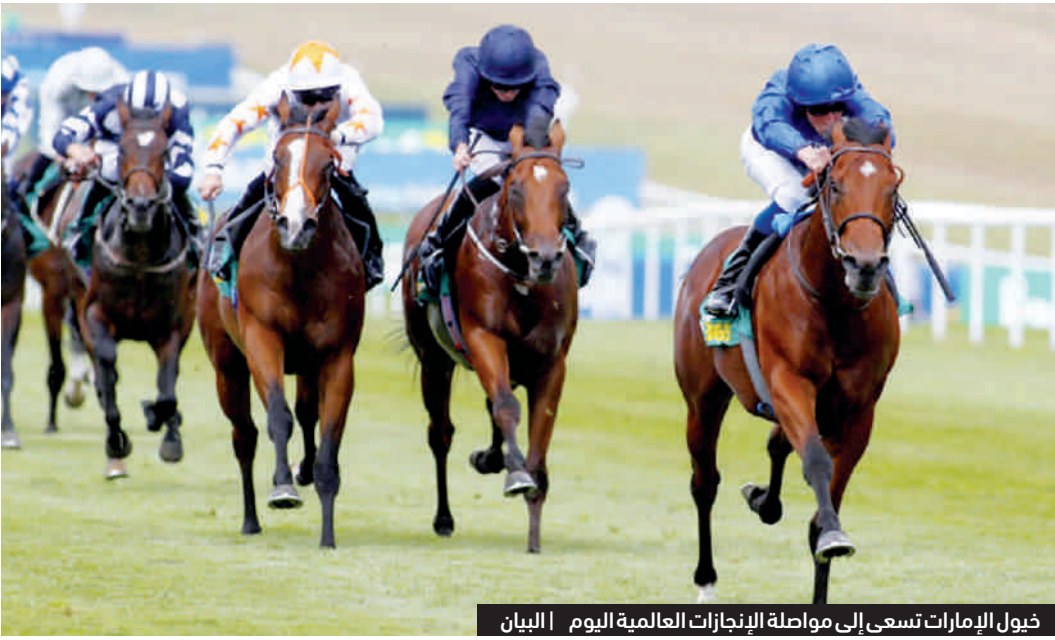
خيول الإمارات تسعى إلى مواصلة الإنجازات العالمية اليوم | البيان